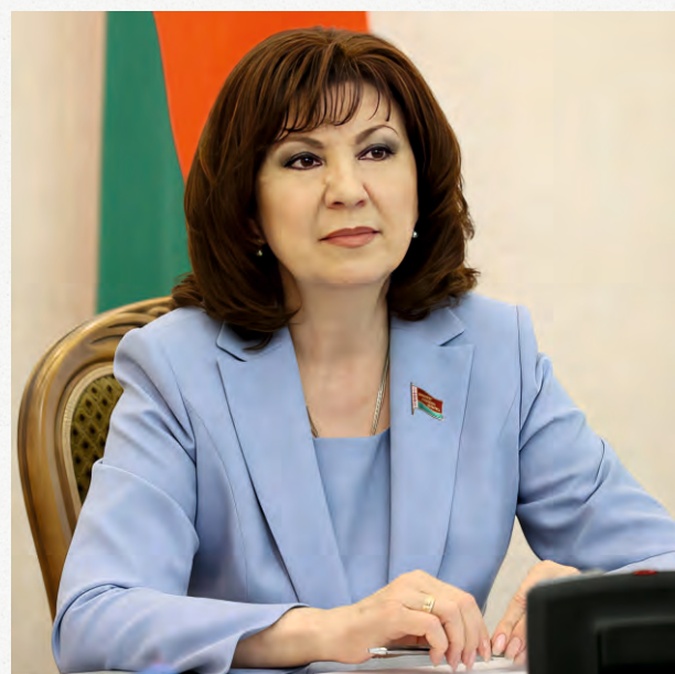
Член Совета ПА ОДКБ Председатель Совета Республики Национального собрания Республики Беларусь Кочанова Наталья Ивановна

“ «ПА ОДКБ - это открытая международная площадка, где принимаются действенные решения по сохранению и защите самого ценного для всех стран и народов - мира, спокойствия и безопасности. Важнее ничего нет»