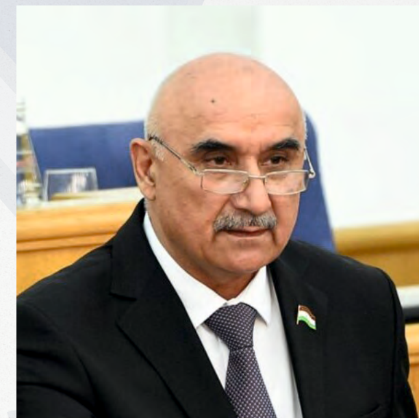
Член Совета ПА ОДКБ Председатель Маджлиси намояндагон Маджлиси Оли Республики Таджикистан Зокирзода Махмадтоир Зоир

“ «Республика Таджикистан последовательно прилагает усилия в реализации программ и стратегий ОДКБ, принимает меры по выполнению решений, направленных на обеспечение деятельности Организации»