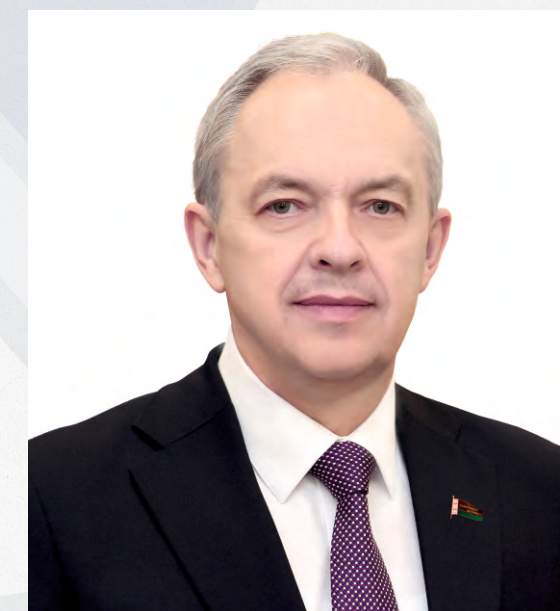
Член Совета ПА ОДКБ Председатель Палаты представителей Национального собрания Республики Беларусь Сергеенко Игорь Петрович

“ «Парламентское измерение ОДКБ является важным фактором обеспечения суверенитета и независимости стран-участниц, гибким инструментом формирования новой архитектуры международных отношений на основе принципов равенства, взаимоуважения и доверия»