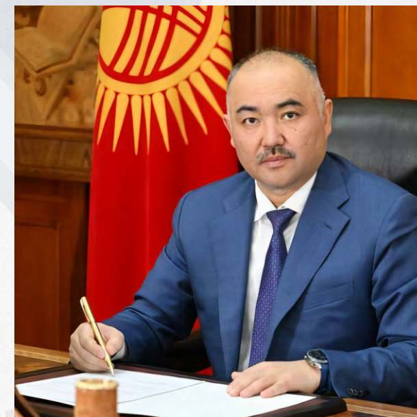
Член Совета ПА ОДКБ Торага (Председатель) Жогорку Кенеша Кыргызской Республики Шакиев Нурланбек Тургунбекович

“ «Кыргызская сторона придаёт важное значение укреплению потенциала ОДКБ и рассчитывает на ощутимый эффект от многостороннего сотрудничества в сфере безопасности в целом. Убеждён, общими усилиями мы сможем достичь повышения его роли в создании более безопасного мира»