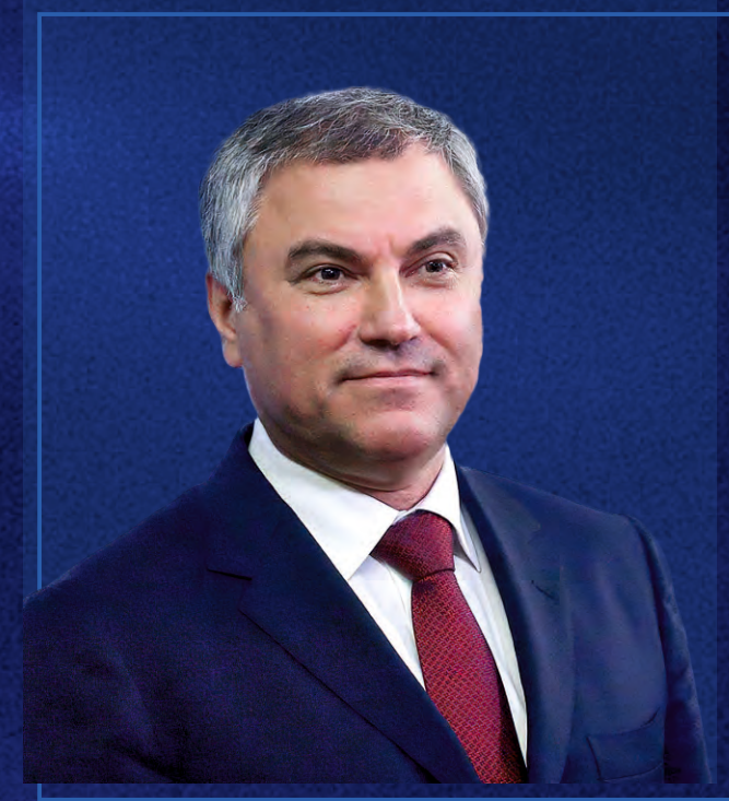
Председатель Парламентской Ассамблеи ОДКБ Председатель Государственной Думы Федерального Собрания Российской Федерации Володин Вячеслав Викторович

“ «Парламентское измерение ОДКБ развивается благодаря поддержке этого формата главами государств. Мы в рамках межпарламентского сотрудничества делаем все для законодательного обеспечения их решений» »