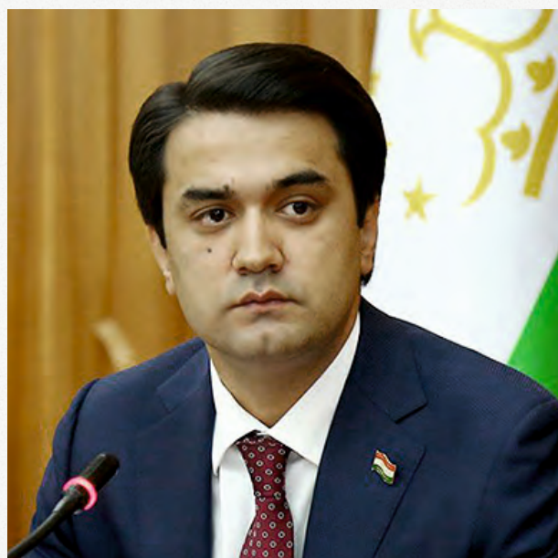
Член Совета ПА ОДКБ Председатель Маджлиси милли Маджлиси Оли Республики Таджикистан Рустами Эмомали

“ «Деятельность ОДКБ является фактором сохранения мира и стабильности в регионе её ответственности. Республика Таджикистан придает приоритетное значение взаимодействию между нашими странами в рамках Организации и выступает за постоянные совместные усилия во имя достижения целей, заложенных в ее Договоре и Уставе»