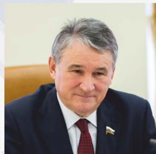
Член Совета ПА ОДКБ Заместитель Председателя Совета Федерации Федерального Собрания Российской Федерации Воробьев Юрий Леонидович

“ «Многие вопросы, рассмотренные на площадке ПА ОДКБ, уже воплощены в реальность. То, что не только члены ОДКБ, но и многие страны обратили внимание на наше сотрудничество, вселяет надежду на расширение радиуса влияния ОДКБ и ее парламентской составляющей в решении вопросов противодействия реальным мировым угрозам»