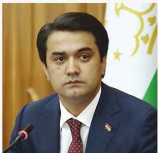
Член Совета ПА ОИК Председатель Маджлиси милли Маджлиси Оли Республики Таджикистан Рустами Эмомали