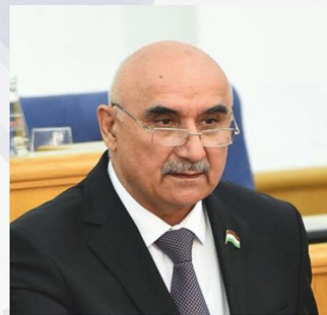
Член Совета ПА ОИК Председатель Маджлиси намояндагон Маджлиси Оли Республики Таджикистан Зокирзода Махматдотир Зоир

“ «Республика Таджикистан последовательно прилагает усилия в реализации программ и стратегий ОИК, принимает меры по выполнению решений, направленных на обеспечение деятельности Организации»