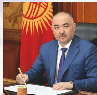
Член Совета ПА ОДКБ Торага (Председатель) Жогорку Кенеша Кыргызской Республики Шакиев Нурланбек Тургунбекович

“ «Кыргызская сторона придаёт важное значение укреплению потенциала ОДКБ и рассчитывает на ощутимый эффект от многостороннего сотрудничества в сфере безопасности в целом. Убеждён, общими усилиями мы сможем достичь повышения его роли в создании более безопасного мира»