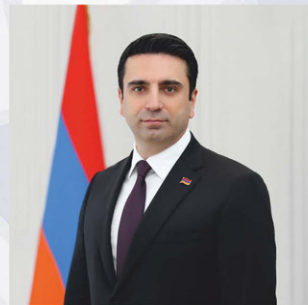
Член Совета ПА ОДКБ Председатель Национального Собрания Республики Армения

«В рамках ПА ОДКБ есть довольно большие возможности для более слаженного и скоординированного взаимодействия на основе взаимной поддержки и учета интересов, особенно по актуальным для наших стран и народов вопросам»