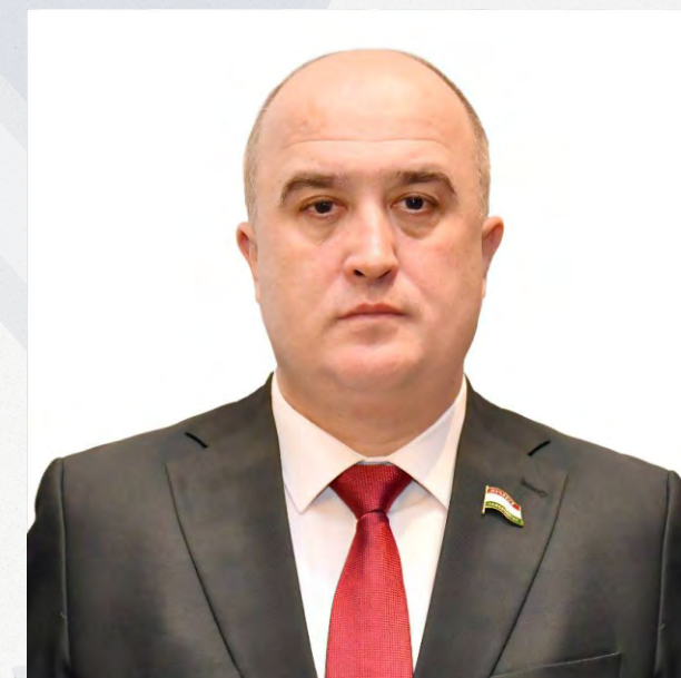
Член Совета ПА ОДКБ Председатель Маджлиси намояндагон Маджлиси Оли Республики Таджикистан Идизода Файзали Фузайлшо

“ «В целях обеспечения безопасности и устойчивого развития более, чем когда-либо, необходима консолидация совместных усилий на глобальном и региональном уровнях»