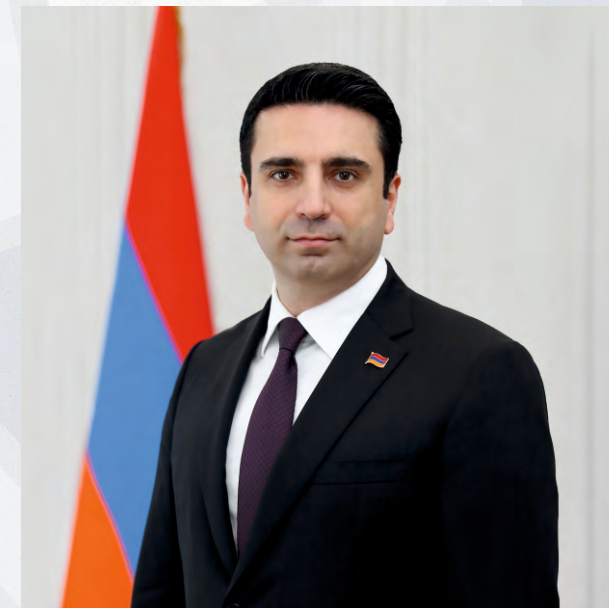
Член Совета ПА ОДКБ Председатель Национального Собрания Республики Армения

«В рамках ПА ОДКБ есть довольно большие возможности для более слаженного и скоординированного взаимодействия на основе взаимной поддержки и учета интересов, особенно по актуальным для наших стран и народов вопросам»