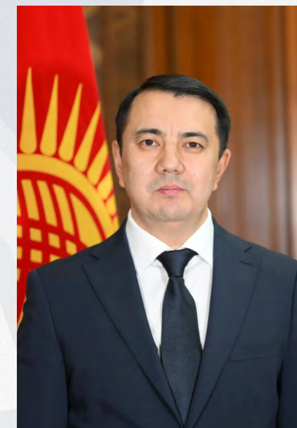
Член Совета ПА ОДКБ Торага (Председатель) Жогорку Кенеша Кыргызской Республики Маматалиев Марлен Абдырахманович

«В условиях современных глобальных вызовов именно парламентская дипломатия и гармонизация наших национальных законодательств становятся тем надежным фундаментом, который позволяет эффективно противостоять общим угрозам и обеспечивать коллективную безопасность, мир и стабильность в нашем регионе»