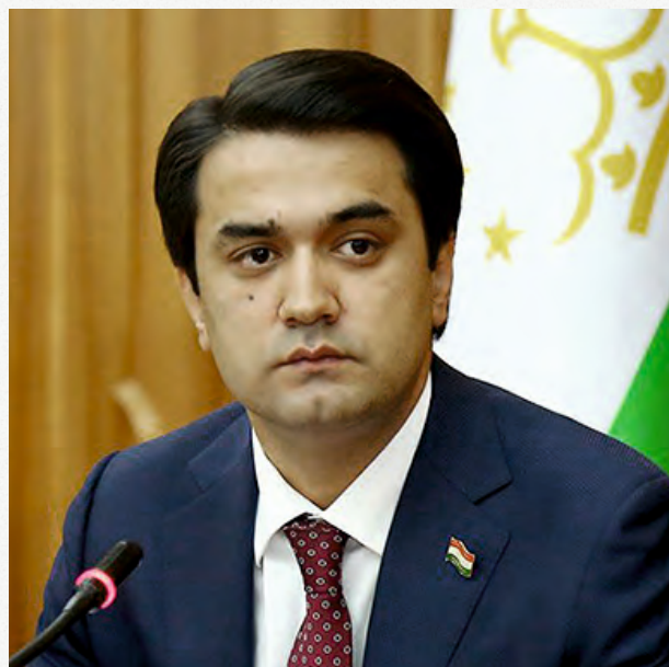
Член Совета ПА ОДКБ Председатель Маджлиси милли Маджлиси Оли Республики Таджикистан Рустами Эмомали

“ «Деятельность ОДКБ является фактором сохранения мира и стабильности в регионе её ответственности. Республика Таджикистан придает приоритетное значение взаимодействию между нашими странами в рамках Организации и выступает за постоянные совместные усилия во имя достижения целей, заложенных в ее Договоре и Уставе»