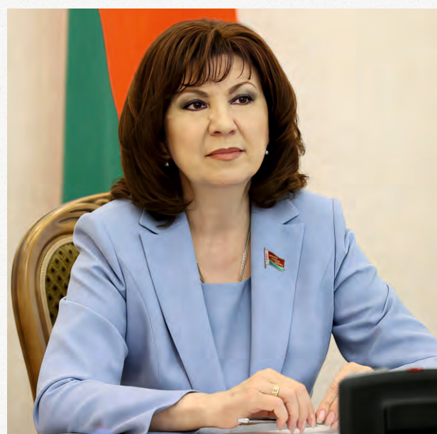
Член Совета ПА ОДКБ Председатель Совета Республики Национального собрания Республики Беларусь Кочанова Наталья Ивановна

“ «ПА ОДКБ — это открытая международная площадка, где принимаются действенные решения по сохранению и защите самого ценного для всех стран и народов — мира, спокойствия и безопасности. Важнее ничего нет»