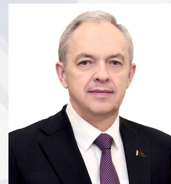
Член Совета ПА ОДКБ Председатель Палаты представителей Национального собрания Республики Беларусь Сергеенко Игорь Петрович

“ «Парламентское измерение ОДКБ является важным фактором обеспечения суверенитета и независимости стран-участниц, гибким инструментом формирования новой архитектуры международных отношений на основе принципов равенства, взаимоуважения и доверия»